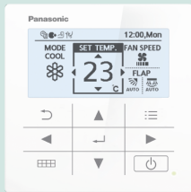
CZ-RD517C. Wired remote controller for wall-mounted and floor console